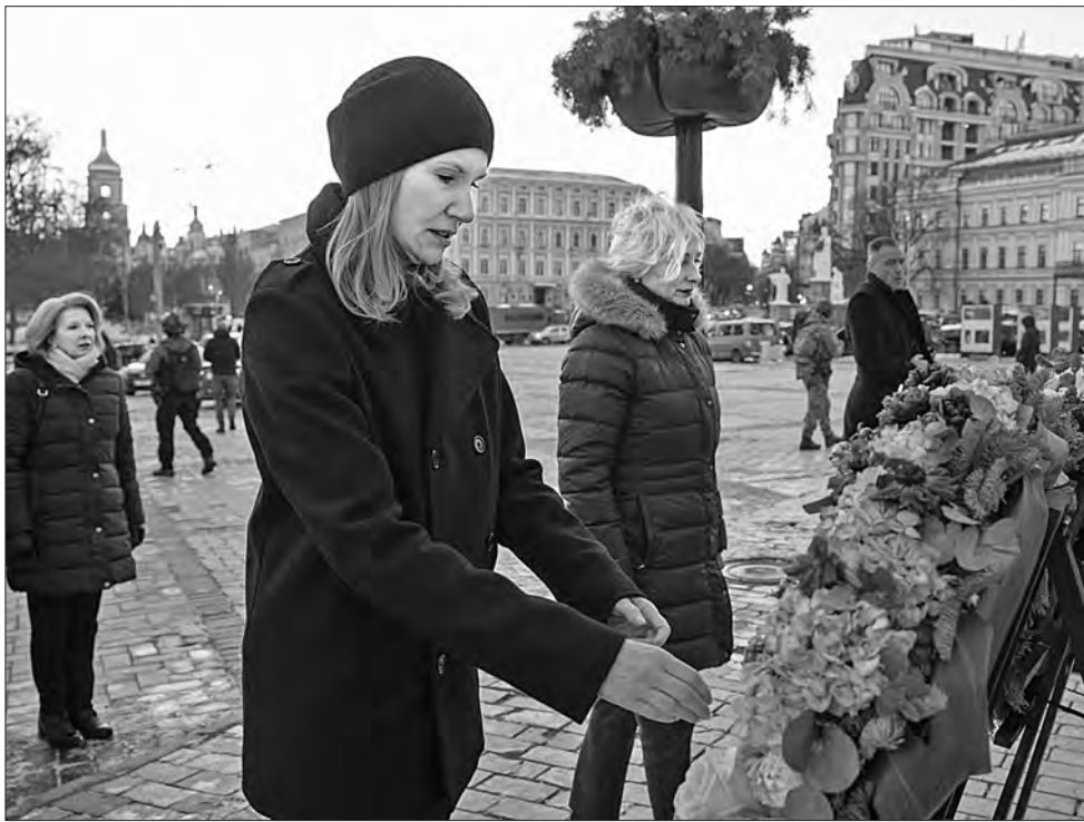
Заступниця Голови Верховної Ради Олена Кондратюк разом з делегацією парламентаріїв Латвії на чолі зі Спікеркою Дайгою Мієрінею поклали вінки до Стіни Пам'яті полеглих Захисників та Захисниць України в російсько-українській війні.